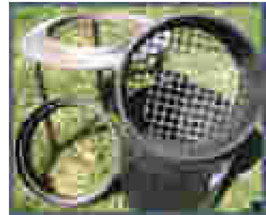
Abb.: 20 L Messzylinder mit Sieb